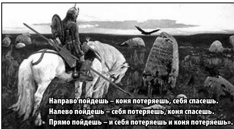
Виктор Михайлович Васнецов. Витязь на распутье. 1882.