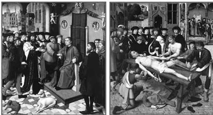
Герард Давид. «Суд Камбиза». Диттих.

Герард Давид – фламандско-нидерландский живописец, представитель раннего Северного Возрождения.